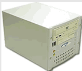
Servidor Box de comunicaciones

Un conexión con la electrónica de red de la empresa permite activar los servicios de comunicaciones que desee en pocos minutos de instalación.